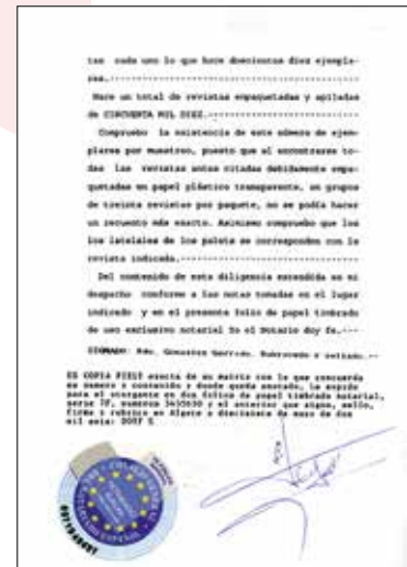
CERTIFICADO DE LA TIRADA DE 50.000 EJEMPLARES DE LA REVISTA DIRIGENTES.

El diario online dirigentesdigital.com publica la actualidad económico-empresarial a nivel mundial