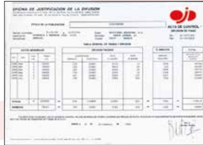
PRIMER ACTA DE CONTROL DE OJD DE LA REVISTA DIRIGENTES.